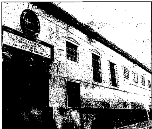
Συμπληρωματικές μελέτες και 3,2 δισ. δρχ. επιστρατεύονται για τη σωτηρία του Ορφανοτροφείου (και μετέπειτα φυλακών) της Αίγινας.

Οι εργασίες στο κτίριο έχουν ξεκινήσει ήδη εδώ και έναν χρόνο, αμέσως μόλις αποχώρησε το Ελληνικό Κέντρο Περιθαψής Αγριών Ζώων, που